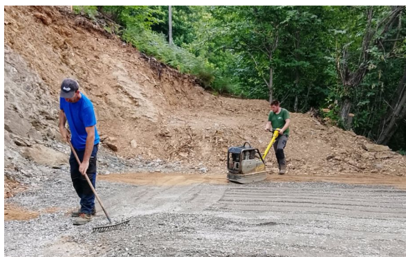
Préparation du terrain à Bournaves par les employés de la commune, après concassage du rocher avec le tractopelle équipé du BRH, coupage des arbres et défrichage des racines

Les employés communaux ont assuré les travaux en régie : coupe des arbres, arrachage des souches et défrichage, mise en place des géotextiles et du concassé O20 pour le nivellement des espaces. Puis la société ALTENBACH installée à Chomérac a livré et installé les citernes. Nos trois nouvelles citernes sont à présent remplies et fonctionnelles. La mairie s'est occupée de poser la signalétique sur les trois sites.