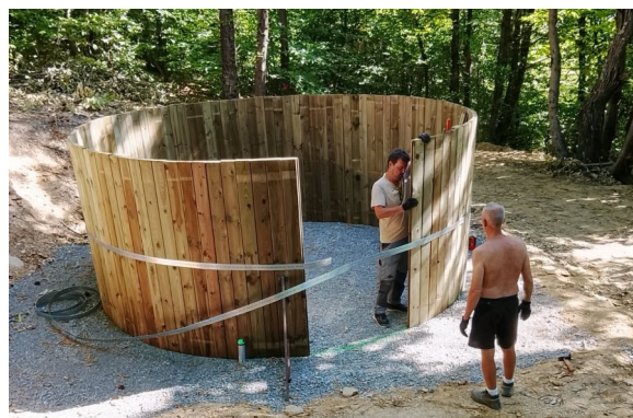
Mise en place de la citerne par les employés de la société Altenbach à la Boissière