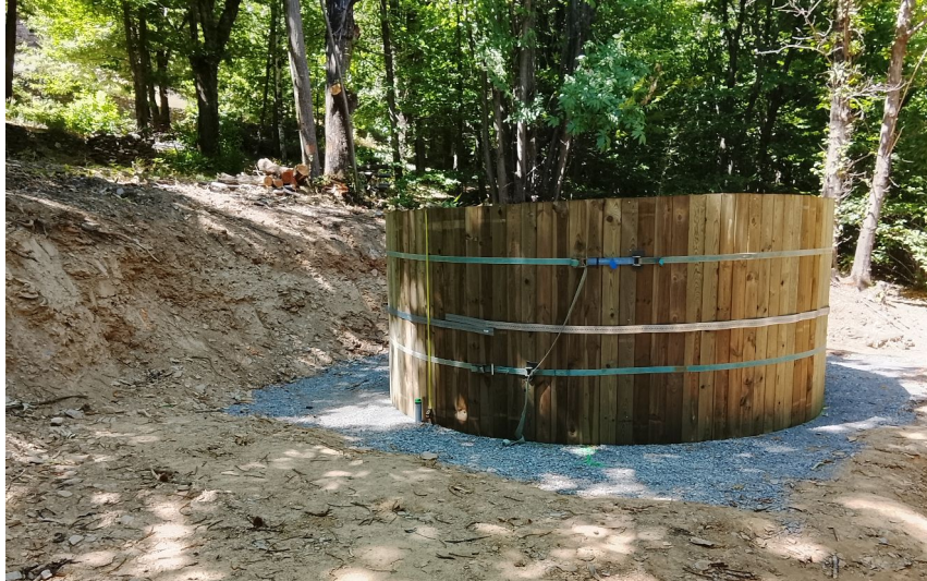
Citerne montée à Elze

Nous attirons votre attention sur la nécessité absolue de respecter l'interdiction de stationner sur l'accès pompier sous peine de verbalisation et d'enlèvement par la fourrière.