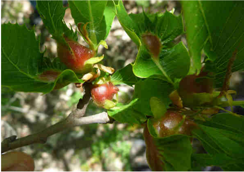
Galles sur feuilles