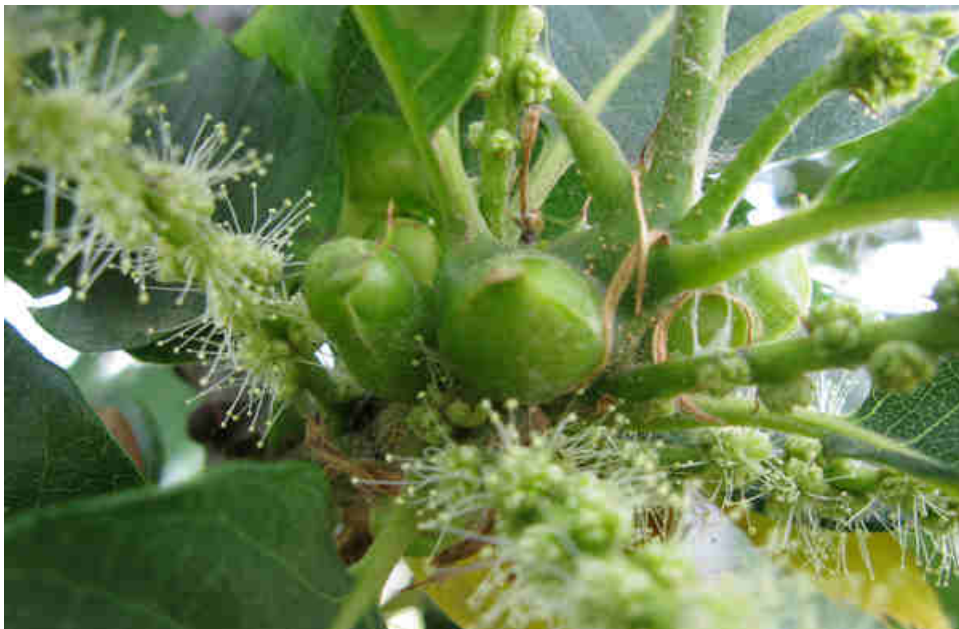
Galles à la base des chatons